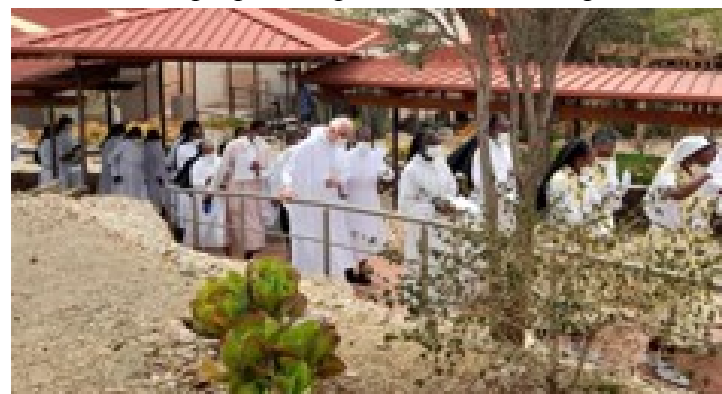
Procissão para o Muro da Memória