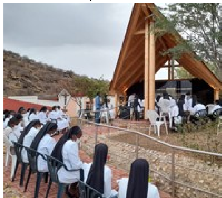
Oração do terço no Muro da Memória