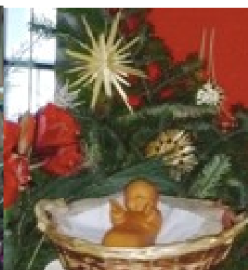
Casa S. Bento